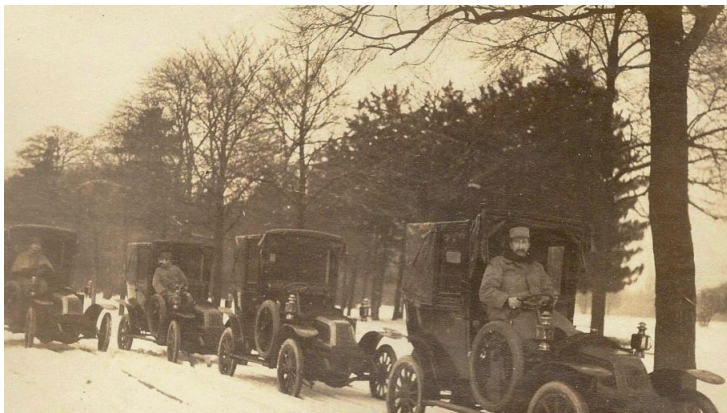
Figure 1 – Les "taxis de la Marne"