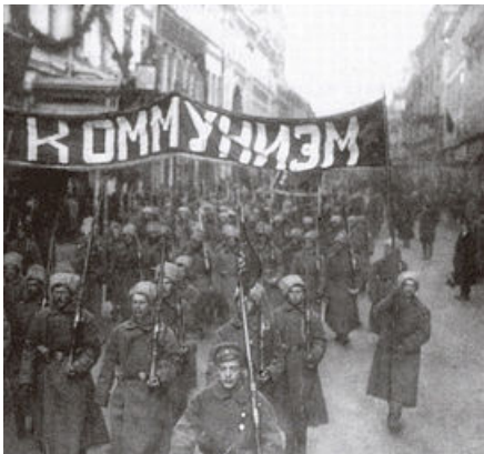
Figure 3 – La Révolution Bolchévique