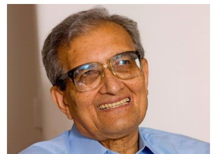
Amartya Sen (1933 - )