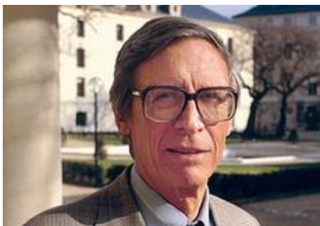
John Rawls (1921 - 2002)